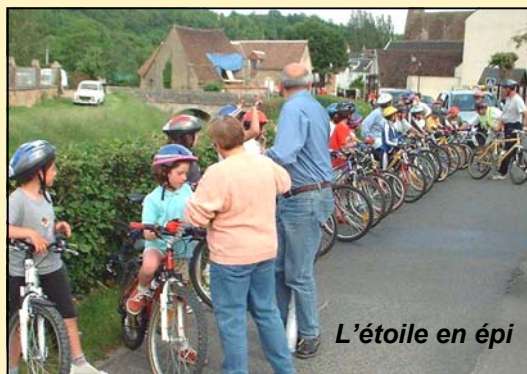
L'étoile en épi