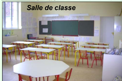
Salle de classe

Côté scolaire, les bâtiments fonctionnels, clairs et spacieux regroupent trois classes, un dortoir, une salle de motricité et également un vaste forum pour assurer l'accueil périscolaire.