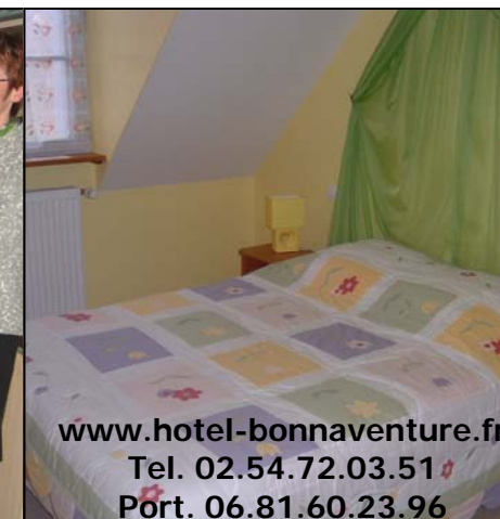
www.hotel-bonnaventure.fr Tel. 02.54.72.03.51 Port. 06.81.60.23.96