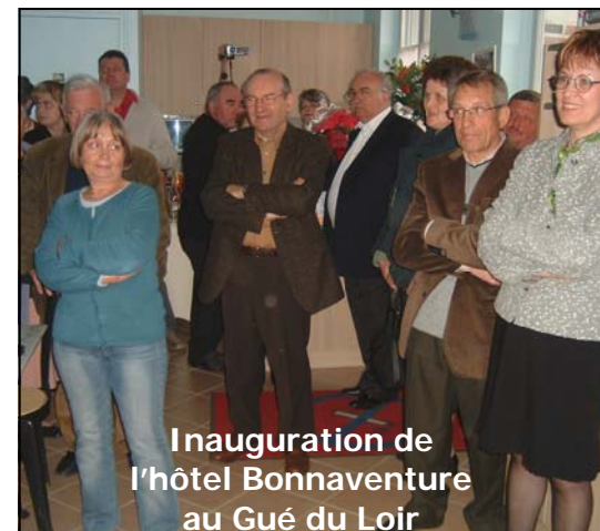
Inauguration de l'hôtel Bonnaventure au Gué du Loir