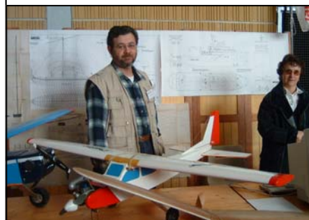
10 et 11 mars 2007 : exposition à la salle Condit de Naveil de la section Modélisme

Vous pouvez d'ores et déjà noter notre prochain rendez-vous :