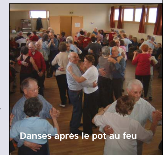
Danses après le pot au feu