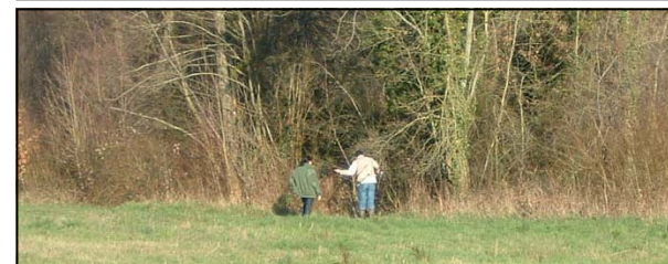
10 mars 2007 : ouverture de la pêche

et de Frédéric MARCHAND (02.54.72.80.67)