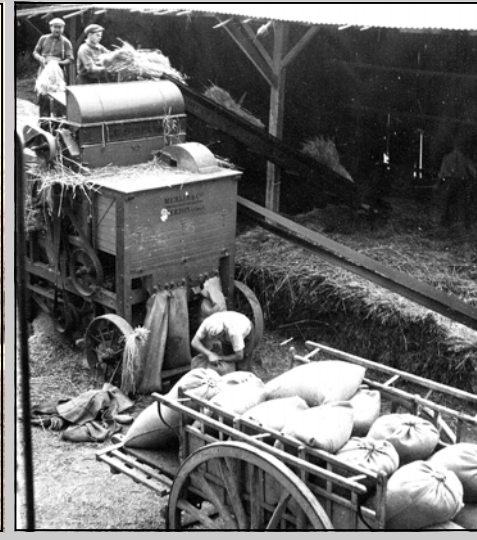
Photos de la batteuse en activité dans la vallée du Boulon.